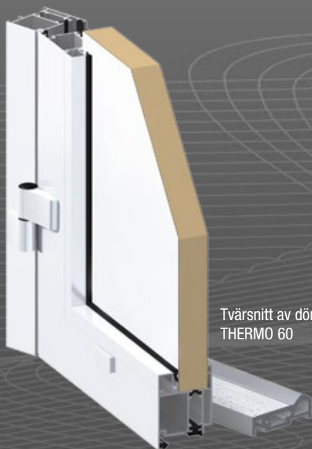
Tvärsnitt av dörren THERMO 60

Dörrfyllningar är fyllda med polyuretanskum, desamma som används i Beditom garageportar som gör för perfekt passform i portar och dörrar.